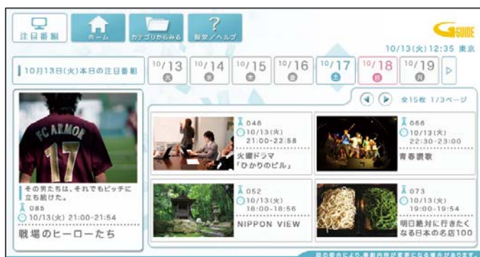
「注目番組」Web版 Top画面(イメージ)

また、将来的に、DVRなどの録画機に対応する際は、放送8日以内の番組の視聴予約・録画予約ができ、見逃し防止にも役立つ仕組みを整備しております。