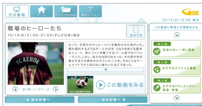
「注目番組」Web版 番組詳細画面(イメージ)