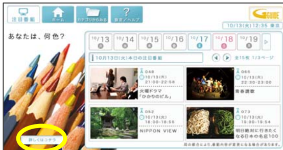
ジャック広告 Top画面(イメージ)