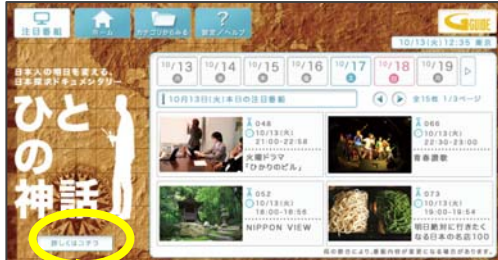
「注目番組」Web版 Top画面(イメージ)